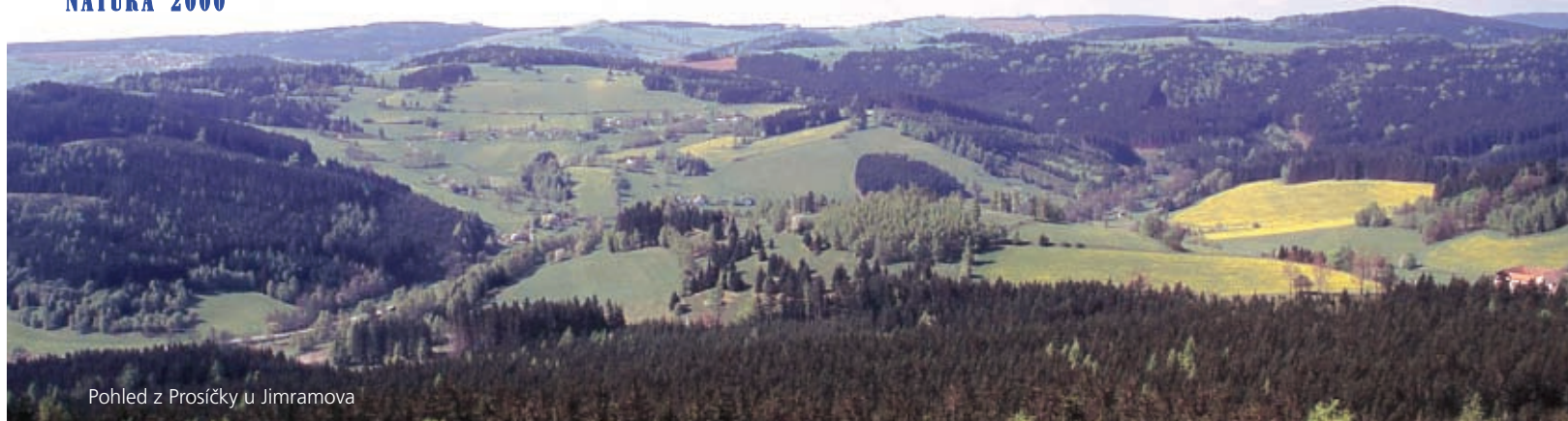
Pohled z Prošičky u Jimramova