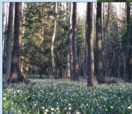
Olšina s bledulí jarní v národní přírodní rezervaci Ransko