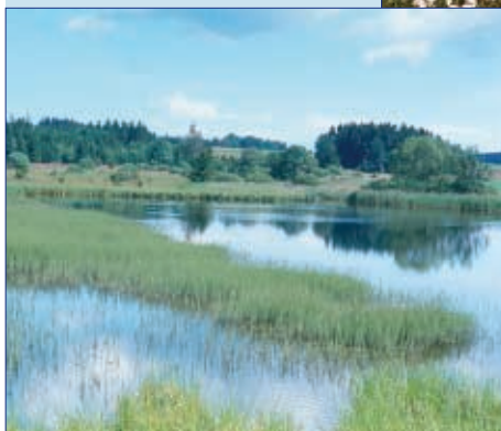
Porosty ostríc a přesličky poříční v přírodní památce Návesník