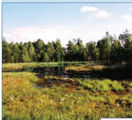
Národní přírodní rezervace Radostínské rašeliniště s výskytem rosnatky okrouhlohlísté a klikvy bahenní