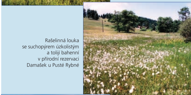
Rašelinná louka se suchopýrem úzkolistým a tolíjí bahenní v přírodní rezervaci Damašek u Pusté Rybné