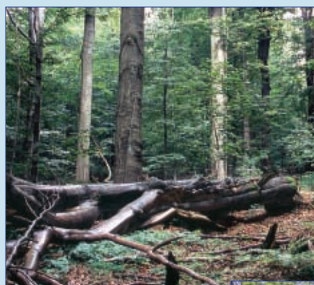
Jedlová bučina v národní přírodní rezervaci Žákova hora