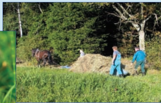
Odvoz sena z vlhkých luk v přírodní památce Louky u Černého lesa