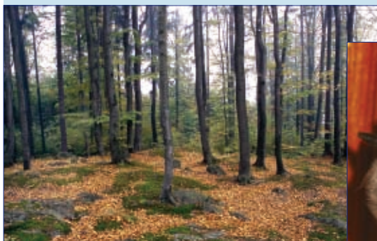
Kyselá bučina v národní přírodní rezervaci Ransko

Doposud bylo na Vysočině navrženo cca 60 drobných lokalit ochrany rostlin a živočichů a něco přes 20 území ochrany přírodních stanovišť, mimo jiné Dářská rašeliniště, Údolí Jihlavy u Mohelna, Divoká Oslava. Na Vysočině nebude vyhlášeno žádné území ochrany ptactva (dle směrnice o ptácích). Početnosti čápa černého, výra velkého, sýce rousného, kulíška nejmenšího a dalších osmi druhů nebyly pro vyhlášení dostatečné.