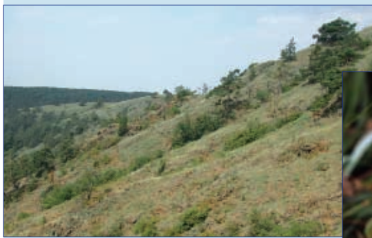
Národní přírodní rezervace Mohelno s výskytem přástevníka kostivalového