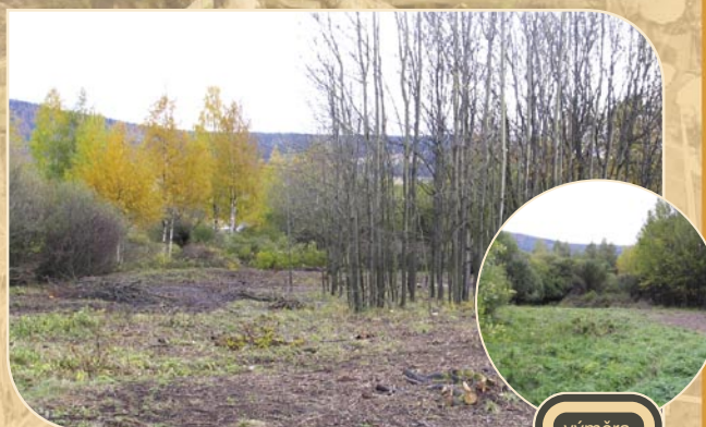
4 BLATINSKÉ LOUKY (Sněžné na Moravě)

Sdružení Krajina se podařilo získat do nájmu obecní pozemek, zastavilo rozšiřování náletu, kosení zabránilo mizení původních druhů rostlin. Podařilo se zamezit dalšímu nelegálnímu zalesňování.