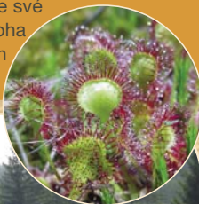
1 CHOTÁRY (Kameničky u Hlinska)