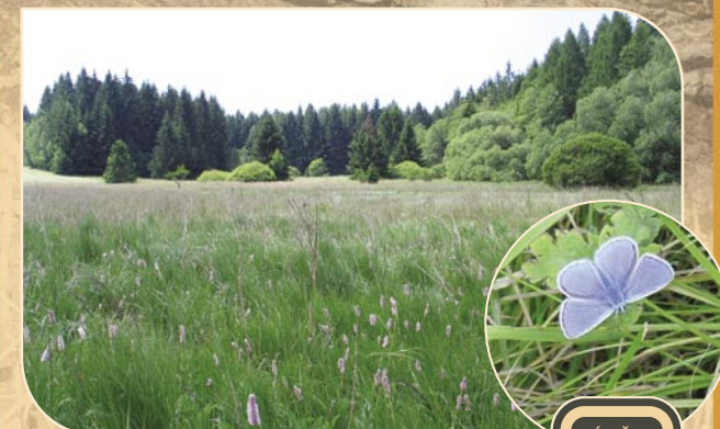
6 PR NIVA DOUBRAVY (Sobiňov u Ždírcce nad Doubr.)

Přitažlivá mozaika suchých trávníků a porostů brusnice střídajících se s mokřinami a rašelinnými oky. V minulosti využívaná částečně jako vojenská střelnice. Dodnes zdroj pitné vody. Dříve nemyslitelná každoroční péče, kterou teď této louce Sdružení Krajina poskytuje, je podmínkou pro výskyt vstaveče fuchsova, tolíje bahenní, suchopýru, čolků.