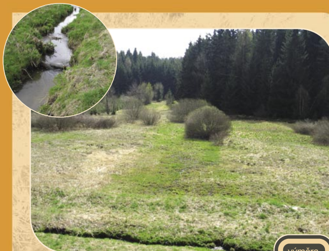
3 ŠAFRANICA (Slavkovice u N. Města n.M.)

Díky odkupu části pozemků mohlo Sdružení Krajina zahájit každoroční péči a zastavit zarůstání dřevinným náletem.