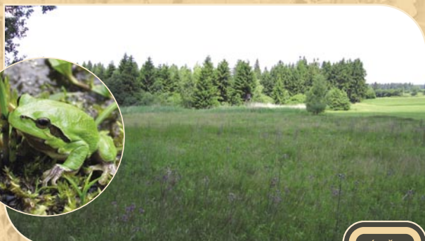
2 DOLINY (Jiřkovice u Nového Města n.M.)

Poměrně rozsáhlé svahové prameniště v minulosti díky nedostatku péče téměř ztratilo svoji hodnotu. Pravidelné ruční kosení umožnilo návrat již vymizelé rosnatky okrouhlolisté. Tato masožravá rostlina, dříve pro Vysočinu typická, se dnes vyskytuje jen na několika málo územích.