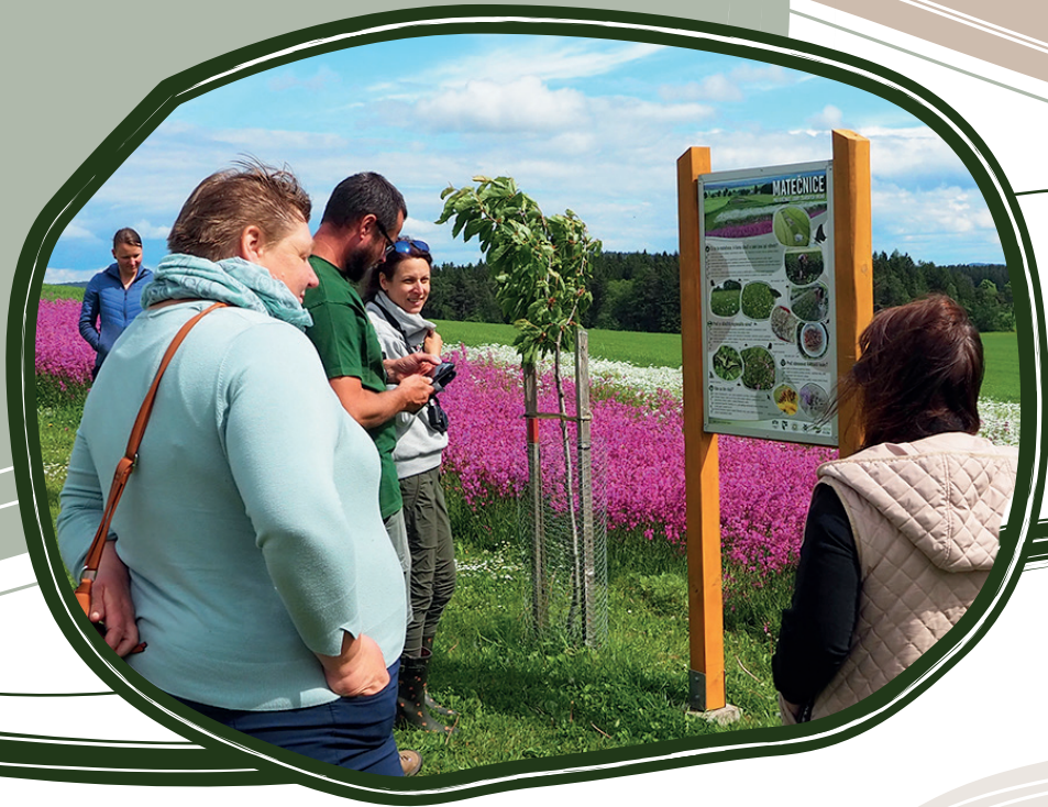
22. 5. Výměna informací k regionálním směsím s kolegy z ČSOP Šumava a firmou Agrostis trávníky, s.r.o.