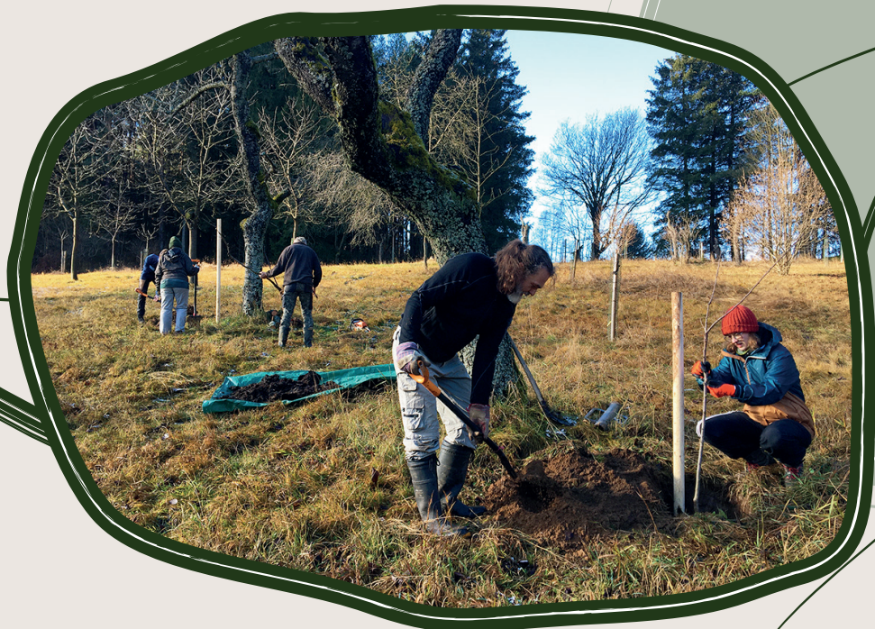
30. 11. Dosadba ovocňáků ve Štursově sadu, Vříšť