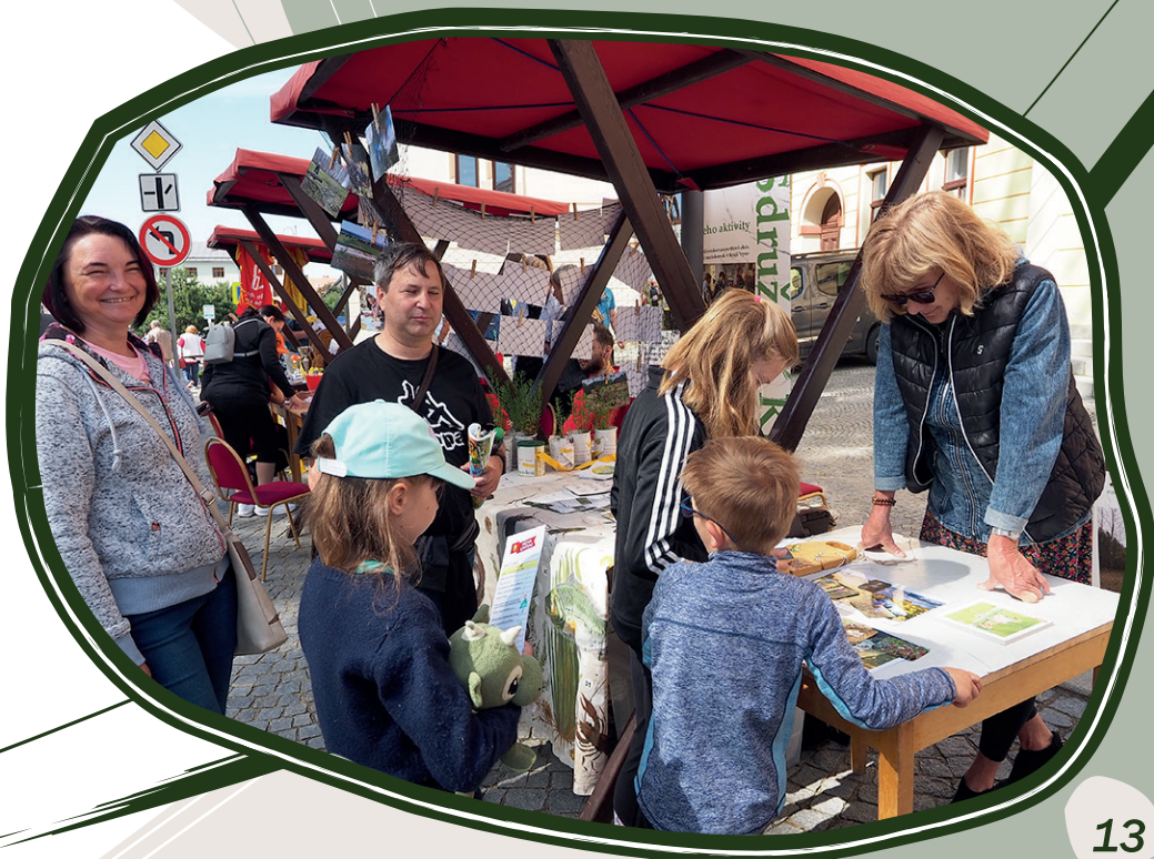
15. 6. Nova Civitas, Nové Město na Moravě