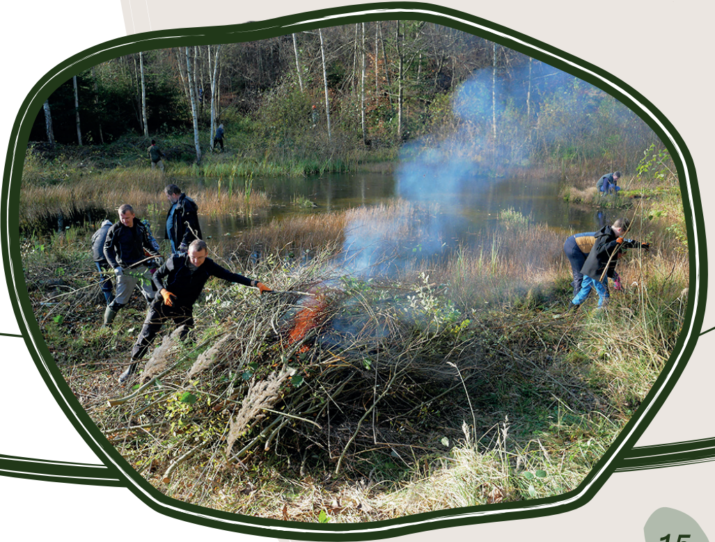
9. 11. Obnova starého pískového lomu, Blatiny