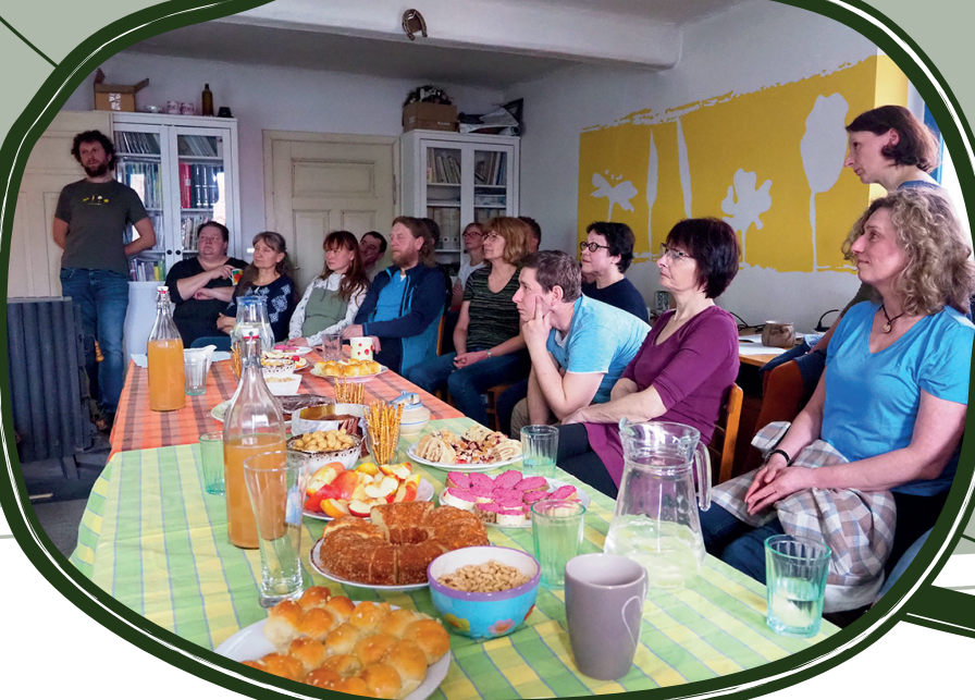
23. 3. Sněm Sdružení Krajina, Počátky