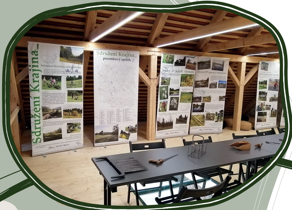
7. 8. - 30. 9. Putovní výstava o praktické ochraně přírody na Veselém kopci