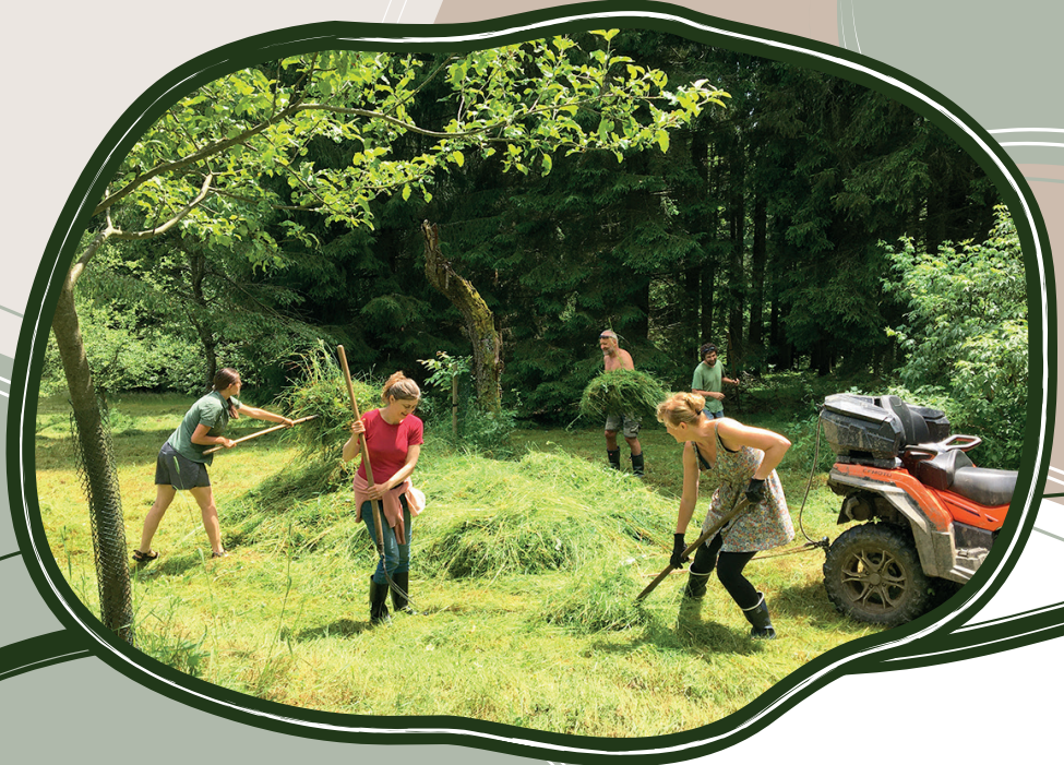
21. - 22. 6. Dobrovolnická kosící a hrabací akce, Štursův sad, Lišná