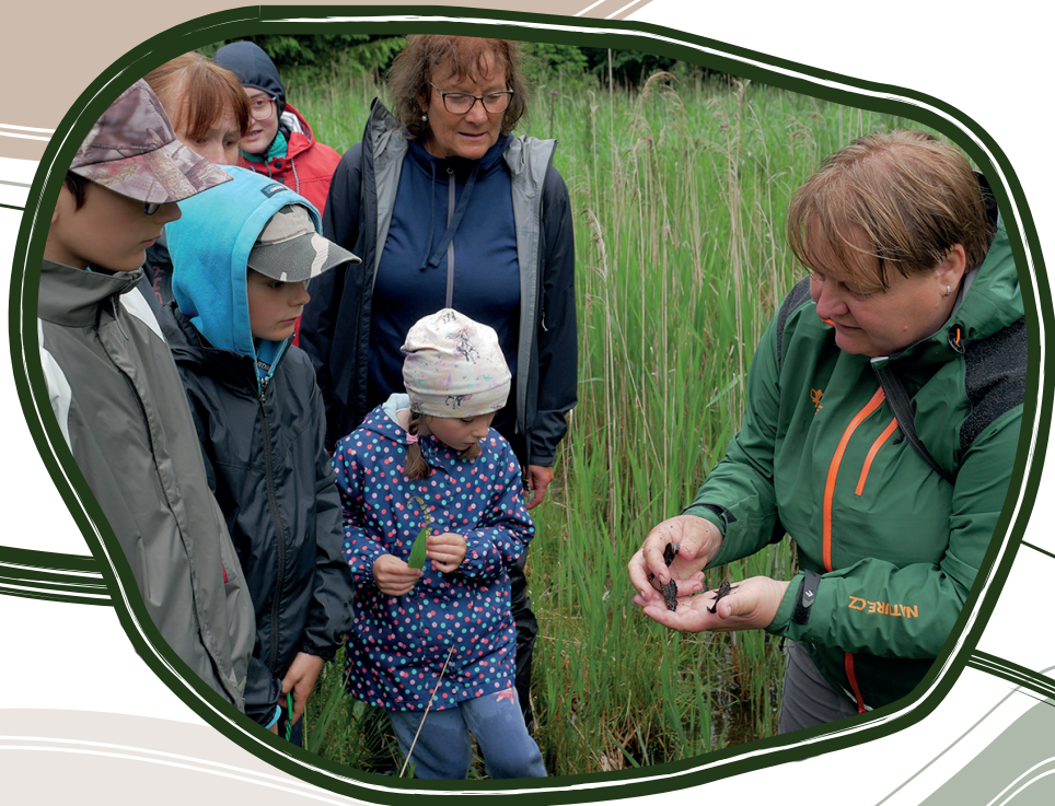
1. 6. Botanicko-zoologická vycházka na matečnici v Jamách a do PP Šafranice