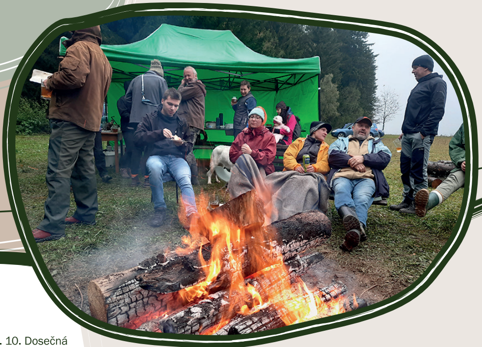
5. 10. Dosečná