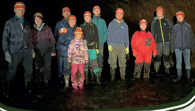
3. - 5. 5. Exkurze v CHKO Moravský kras