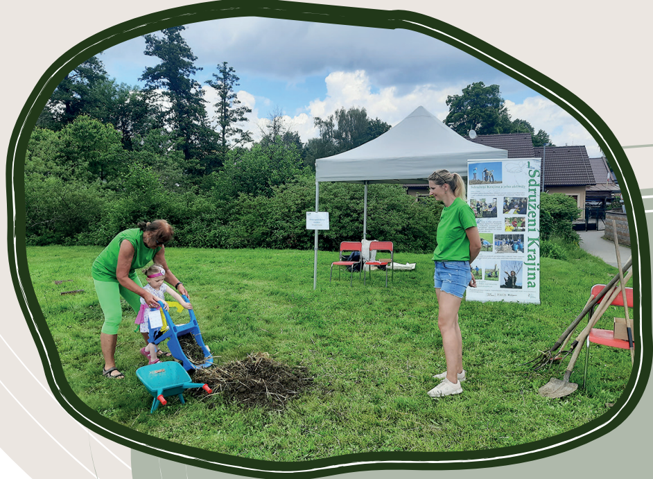
8. 6. Dny Žďáru, Žďár nad Sázavou