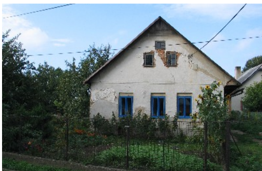
„Staronové“ sídlo Sdružení Krajina v Počítkách